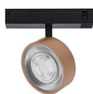
NOIR MAT - CUIVRE MAT