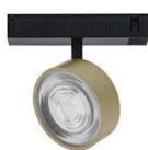
NOIR MAT - LAITON MAT